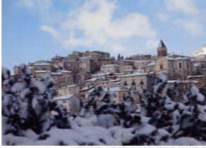
AUTORE: (FOTO PRESEPE VIVENT)