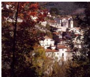
AUTORE: (FOTO URSITI)