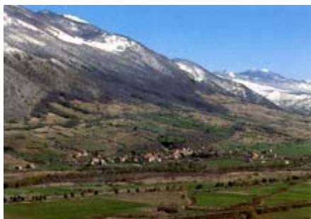
AUTORE: (FOTO DI VITO)