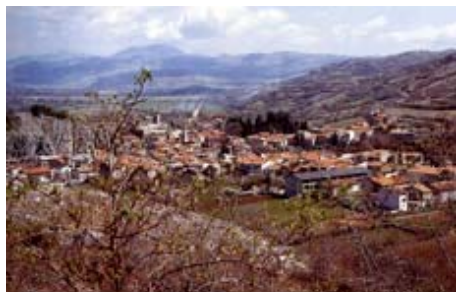
AUTORE: (FOTO URSITTI)